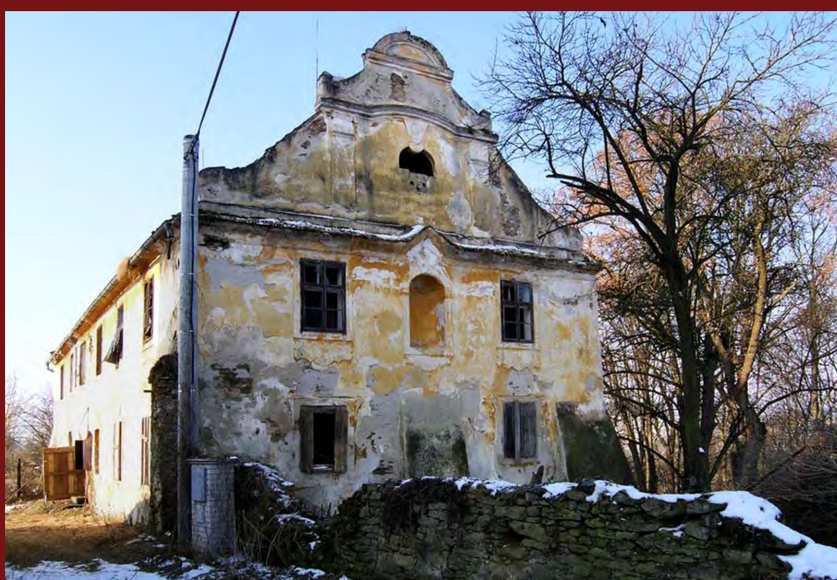
Průčelí fary, r. 2010 Front of the Vicarage, 2010