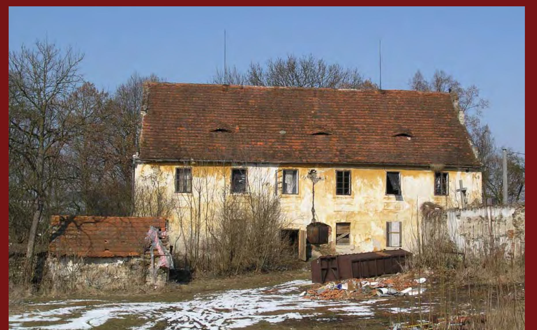
Jihovýchodní průčelí, r. 2010 South-East Front, 2010