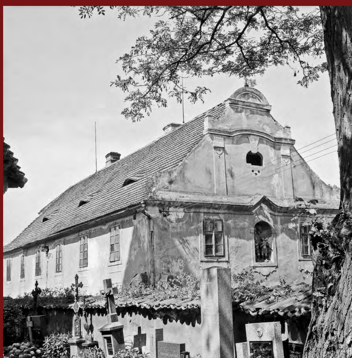
Průčelí fary, r. 1969, archiv NPÚ Front of the Vicarage, 1969, NHI Archives