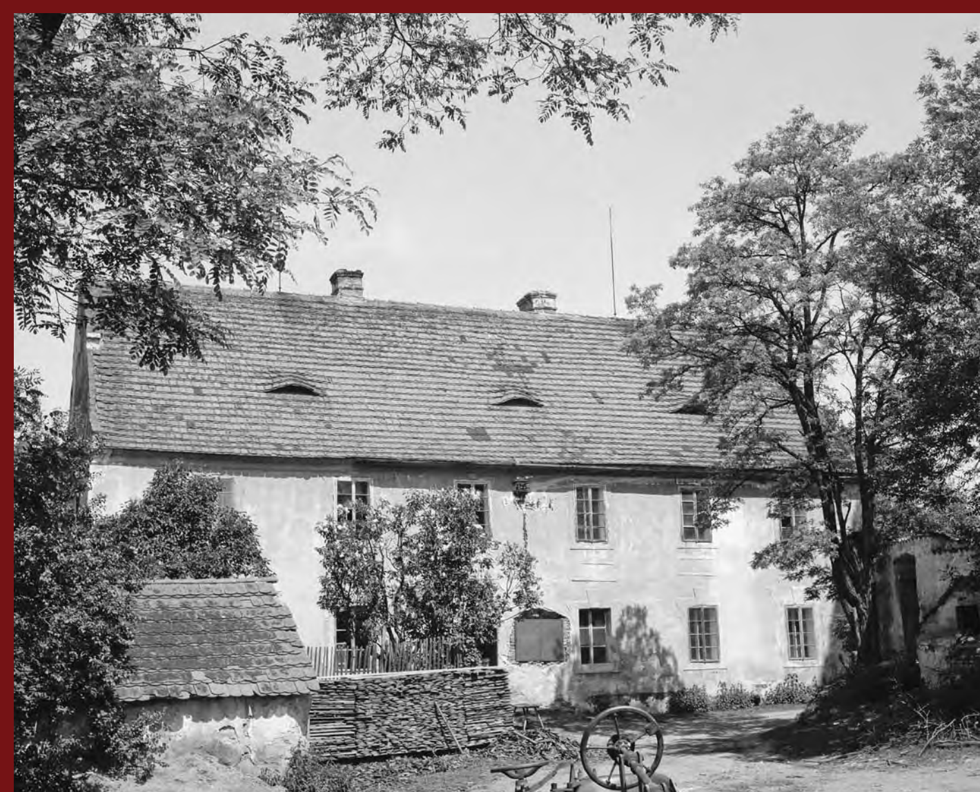
Jihovýchodní průčelí, r. 1969 South-East Front, 1969