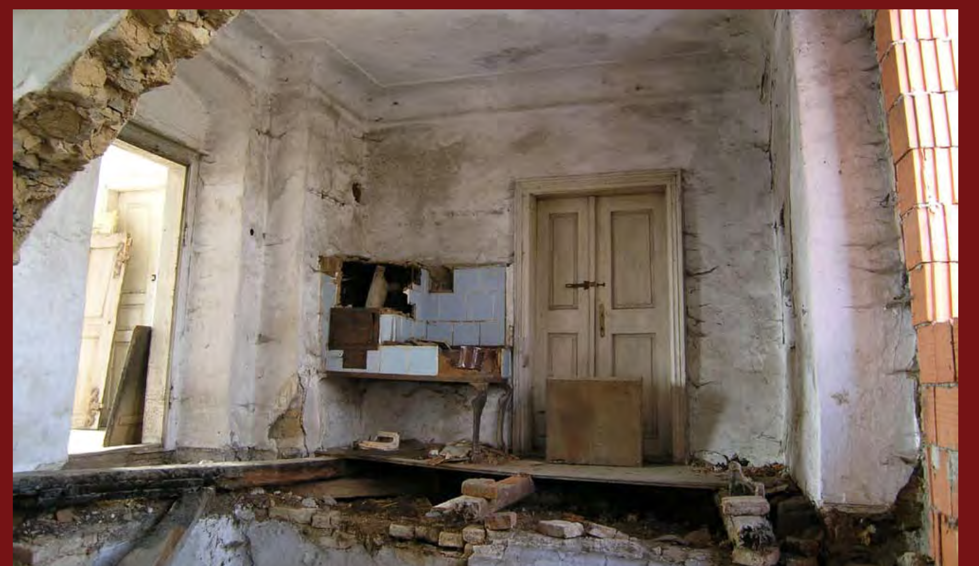
Pokoj v patře, r. 2010 Room upstairs, 2010