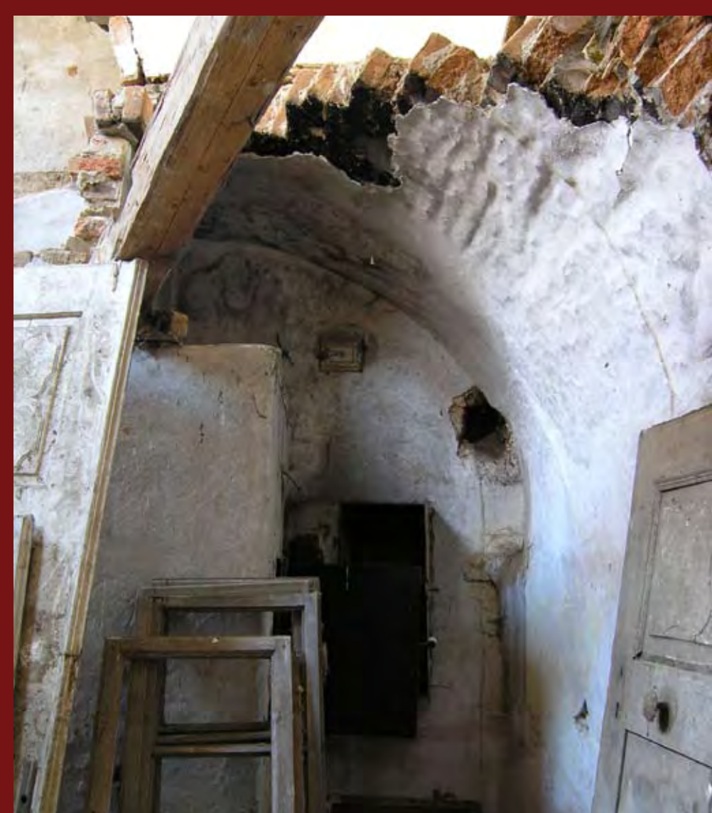
Bývalá černá kuchyně v přízemí, r. 2010, archiv NPÚ Former Black Kitchen on the ground-floor, 2010, NHI Archives